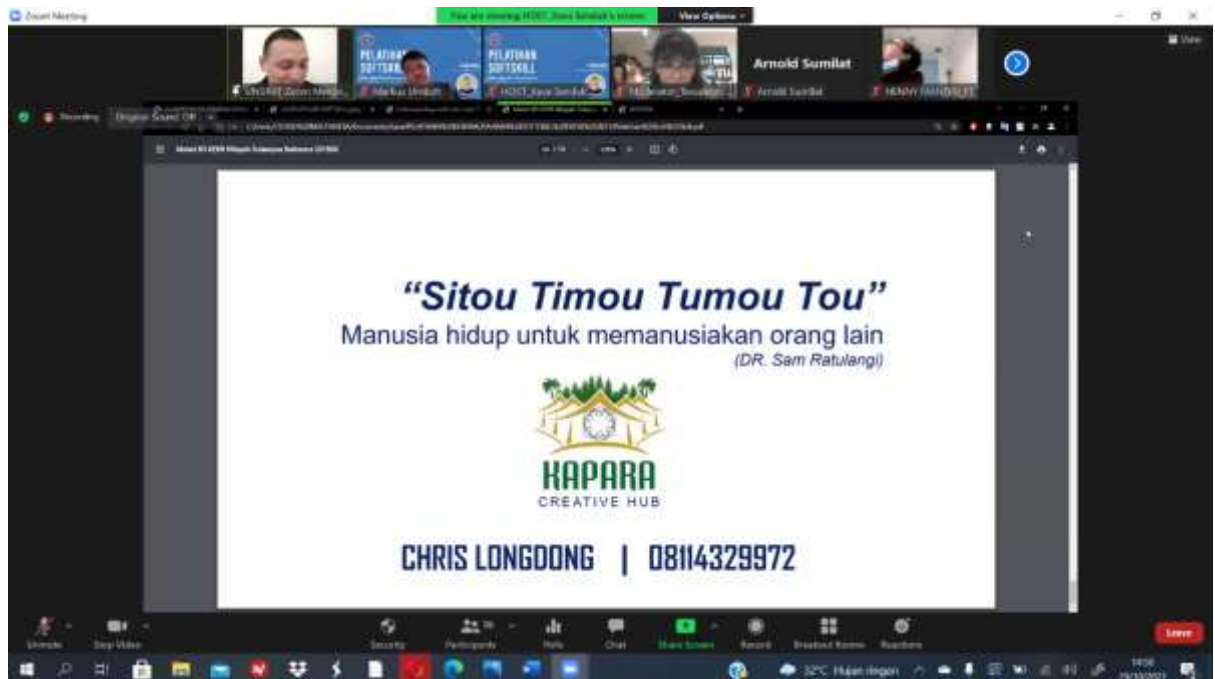
Beberapa penggalan materi yang disampaikan oleh Chrisye Longdong, ST tentang kegiatan wirausaha yang dilakukan oleh Beliau.