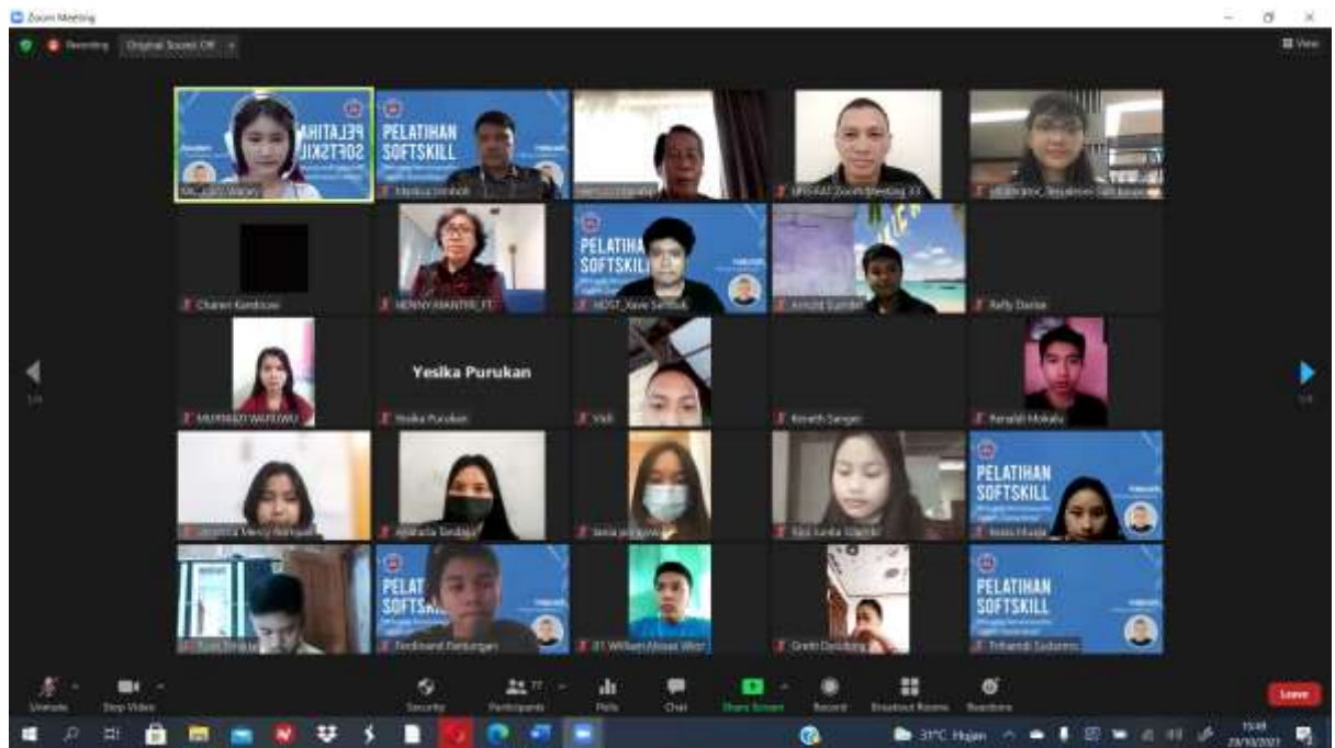
FOTO BERSAMA PESERTA DARING PELATIAHAN SOFT SKILL